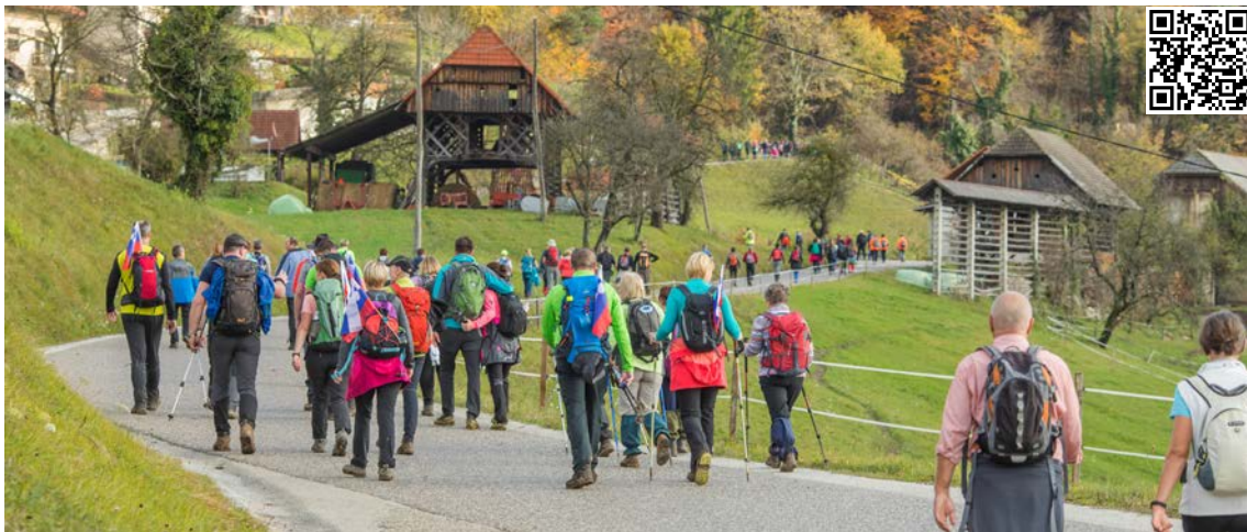
340 km pohodniških poti