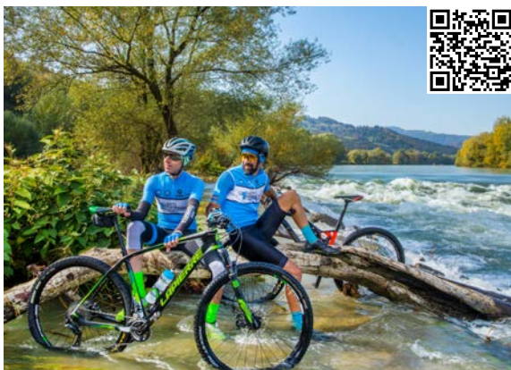
380 km kolesarskih poti

Skrivnosti pod zemljo. Adrenalinsko podežetje. Bogastvo narave. Drugačna kulinarika. Edinstvena doživetja. Samo v Litiji lahko prisiuhnite rasti kapnikov, se dotaknete težiščne točke Slovenije in spustite po enem najdaljših gozdnih zipline-ov v Sloveniji.